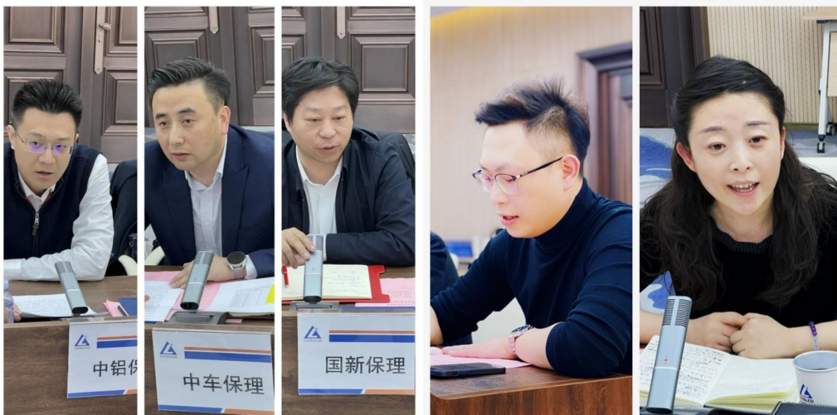
从左至右为中铝商业保理有限公司、中车商业保理有限公司、国新商业保理有限公司

首先由中铝商业保理有限公司、中车商业保理有限公司、国新商业保理有限公司、天津及北京协会的领导依次致辞。